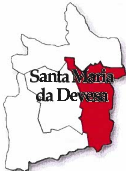
Figura 1 - Localização da freguesia

N.º de Eleitores: À data de 31 de dezembro do ano em questão, a Freguesia de Santa Maria da Devesa, possuía um total de 1286 eleitores.