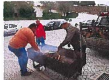
Figura 14 -Registos Fotográficos do Evento Outono em Festa – II Matança do Porco