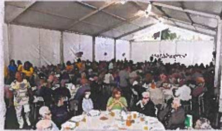
Figura 12 -Registos Fotográficos do Dia do Idoso

As Juntas de Freguesia do Concelho, com o apoio da Câmara Municipal de Castelo de Vide contribuíram para as comemorações do dia do idoso. Oferta do bolo comemorativo no valor de 112,50€ .