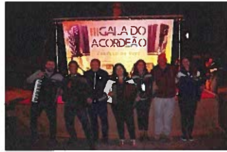
Figura 10 -Registos Fotográficos da III Gala de Acordeão