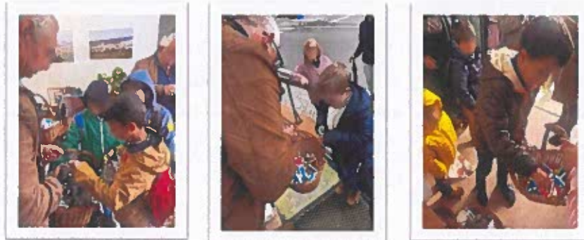
Figura 13 -Registos Fotográficos do Dia de todos os Santos

As Juntas de Freguesia do Concelho de Castelo de Vide, ofereceram guloseimas às crianças para celebração do Dia Mundial de todos os Santos. Coube a esta junta o valor de 114,00€ .