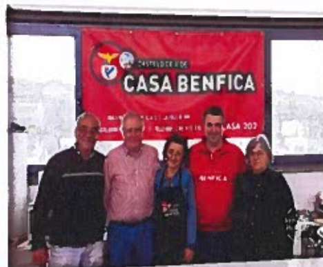
Figura 7 -Registos Fotográficos do Evento Fados e Sopas Solidárias