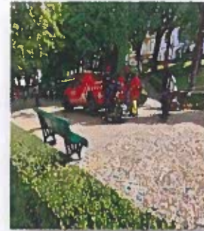
Figura 8 -Registos Fotográficos do Dia da Criança