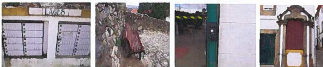
Figura 2 - Registos Fotográficos dos trabalhos de natureza simples

Colocação de sinalização nos aquedutos do Outeiro da Forca, na Senhora do Carmo, no Ribeiro da Vide e Prado.