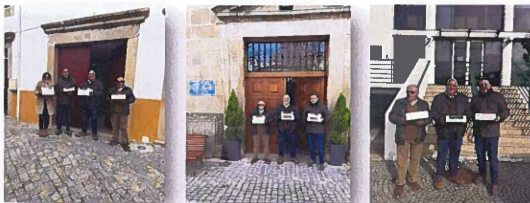
Figura 3 - Registos Fotográficos Dia de Reis

O Executivo desta Junta de Freguesia e em parceria com as restantes Juntas de Freguesia da sede do Concelho, ofertar “Bolos Reis” às Instituições de Solidariedade Social, nomeadamente à Fundação Nossa Senhora da Esperança e à Santa Casa da Misericórdia, cabendo a esta Junta uma despesa no valor de 192,00€ .