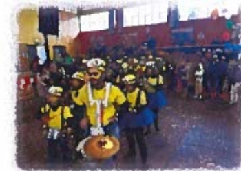
Figura 5 - Registos Fotográficos do Carnaval 2024