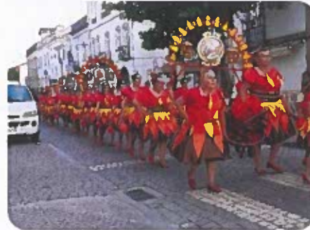
Figura 9 -Registos Fotográficos da Marcha Popular