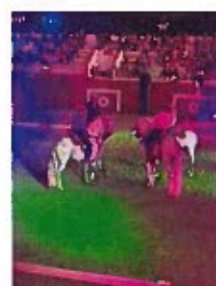
Figura 11 -Registos Fotográficos da Gala Equestre