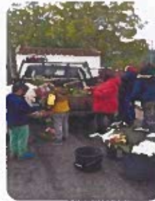
Figura 6 -Registos Fotográficos da Caminhada das Cruzes