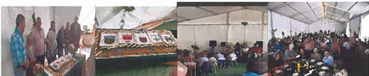
Figura 10- Fotografias do dia do idoso