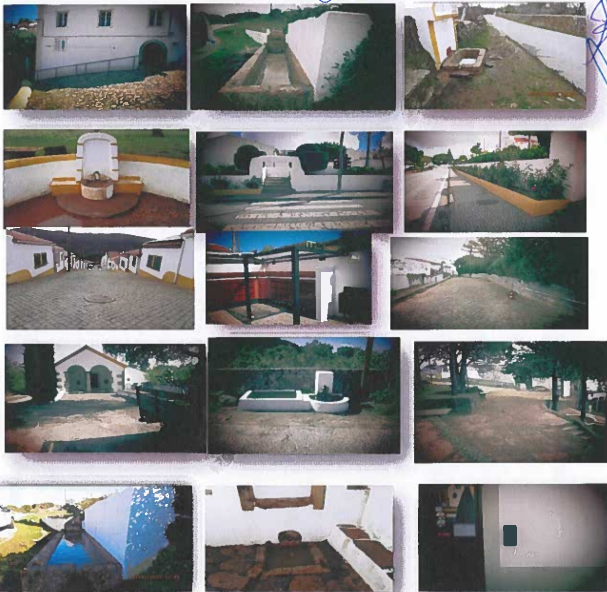
Figura 1-Fotografias de espaços limpos