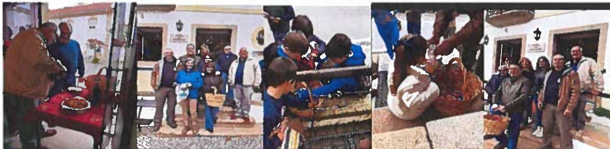
Figura 11- Fotografias do dia dos santos

Oferta de guloseimas às crianças, coube a esta Junta de Freguesia o valor de 45,50€ .