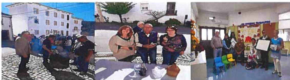
Figura 12- Fotografias do dia de São Martinho

Em colaboração com as Juntas de Freguesia de São João Baptista e Santiago Maior, prestámos apoio na realização de um magusto no dia de S. Martinho, para as crianças que frequentam o Agrupamento de Escolas e o Centro Paroquial de Assistência de Castelo de Vide.