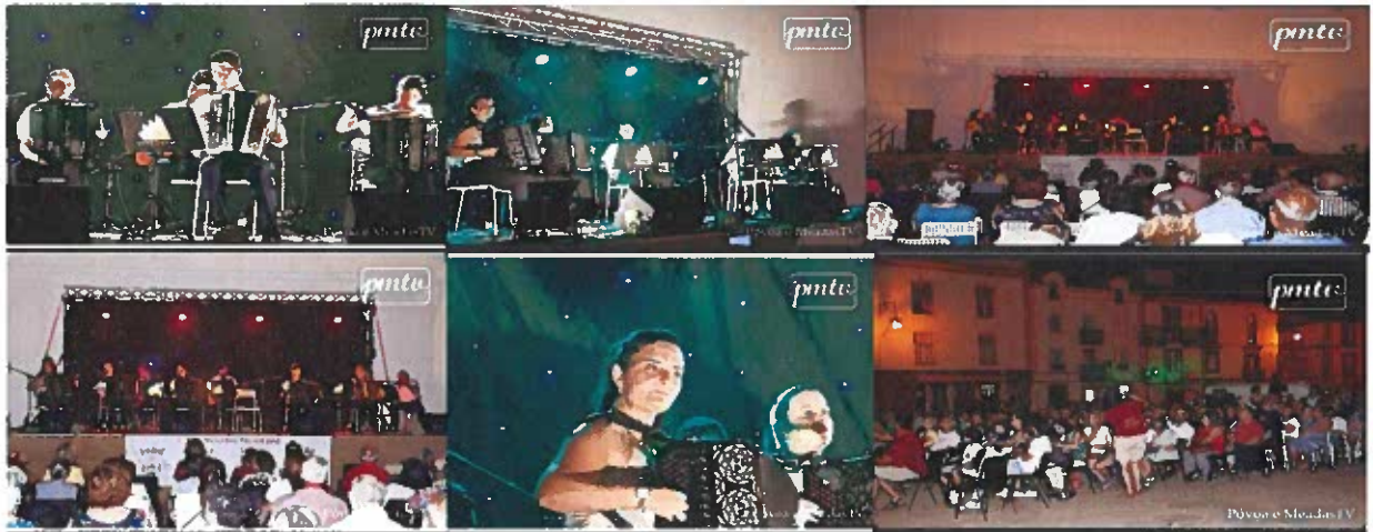
Figura 7-Fotografias da Gala de Acordeão

As Juntas de Freguesia do Concelho, com o apoio da Câmara Municipal de Castelo de Vide e da Associação Humanitária dos Bombeiros Mistos de Castelo de Vide participaram nas despesas da Gala de Acordeão com um custo total de 2.331,10€ , coube a esta Junta o valor total de 769,34€ .