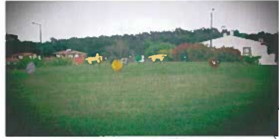
Figura 4- Fotografias das decorações pascais