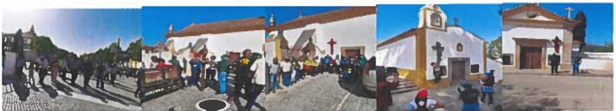
Figura 5- Fotografias da caminhada das cruzes

À semelhança dos anos anteriores, foi realizada mais uma Caminhada das Cruzes . Juntando cerca de 50 caminheiros, foram colocadas flores na Igreja de São João Baptista, na Igreja de São Pedro e na Igreja de São Vicente de Ferrer. No final houve um lanche convívio, composto por um sumo, um queque, um pão com chouriço e uma laranja oferecido pelas 3 Juntas de Freguesia de Santa Maria da Devesa, de Santiago Maior e de São João Baptista, cabendo à Junta de Santa Maria da Devesa a despesa de – 132,00€ e 50 pés de flores (gerberas) – 20,00€.