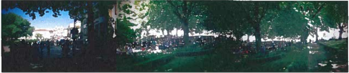
Figura 6- Fotografias caminhada avós e netos