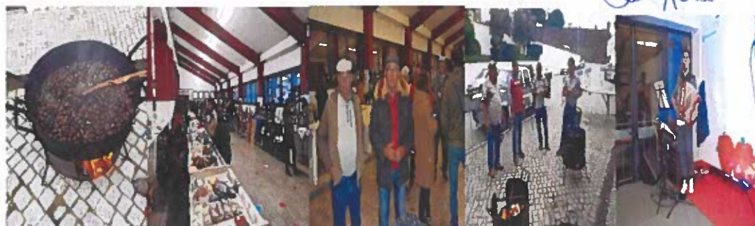
Figura 13- Fotografias do evento "Outono em Festa"