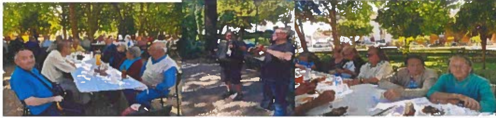
Figura 8-Fotografias do convívio dos santos populares