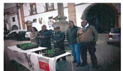
Figura 3- Fotografias do Dia Internacional da Mulher