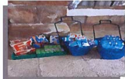
Figura 2-Fotografias de bens essenciais