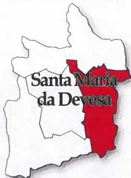
Figura 1 - Localização da freguesia

Face ao estipulado na alínea e) do n.º 2 do art.º 9.º da Lei n.º 75/2013 de 12 de setembro, a informação divulgada neste relatório incide sobre a atividade realizada pela Junta de Freguesia no período entre janeiro e março do corrente ano nos diversos domínios de intervenção que se descreve em pormenor de seguida: Os gastos atribuídos, em subsídios, ação social, recursos humanos, património e outras atividades realizadas.