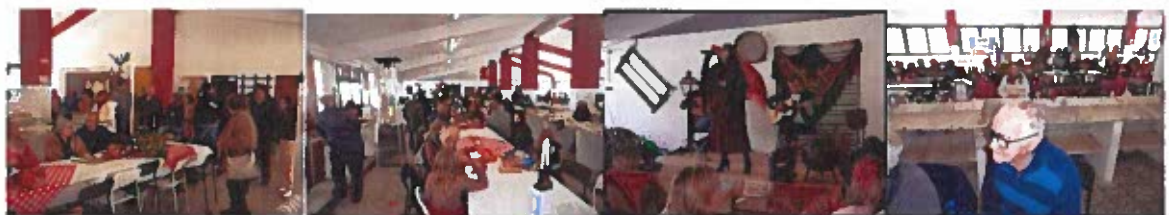
Figura 3 - Fotografias Fados e Sopas Solidárias