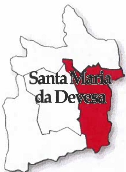
Figura 1 - Localização da freguesia

Face ao estipulado na alínea e) do n.º 2 do art.º 9.º da Lei n.º 75/2013 de 12 de setembro, a informação divulgada neste relatório incide sobre a atividade realizada pela Junta de Freguesia no período entre janeiro e março do corrente ano nos diversos domínios de intervenção que se descreve em pormenor de seguida: Os gastos atribuídos, em subsídios, ação social, recursos humanos, património e outras atividades realizadas.