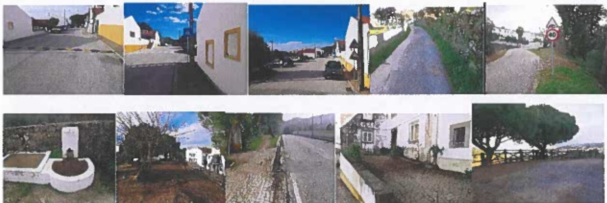
Figura 2 - Fotografias de espaços limpos