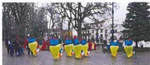
Figura 3 – Registos Fotográficos do Carnaval