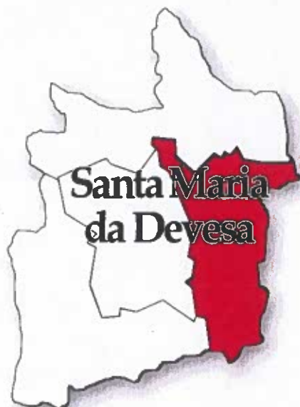
Figura 1 - Localização da freguesia

Face ao estipulado na alínea e) do n.º 2 do art.º 9.º da Lei n.º 75/2013 de 12 de setembro, a informação divulgada neste relatório incide sobre a atividade realizada pela Junta de Freguesia no período entre janeiro e março do corrente ano nos diversos domínios de intervenção que se descreve em pormenor de seguida: Os gastos atribuídos, em subsídios, ação social, recursos humanos, património e outras atividades realizadas.